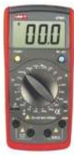
D J TAL MULT METRE