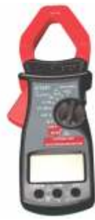
D J TAL PENSAMPERMETRE