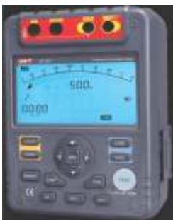
MOTOR ZOLASYON TEST C HAZI